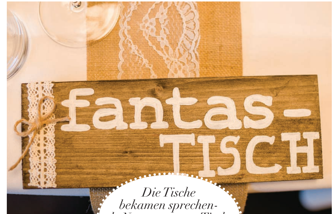
Die Tische bekamen sprechende Namen: romanTisch, galakTisch, giganTisch ...

gerne als Tipp weiter an alle Brautpaare, die, was Schmuck betrifft, einen ganz unterschiedlichen Geschmack haben.